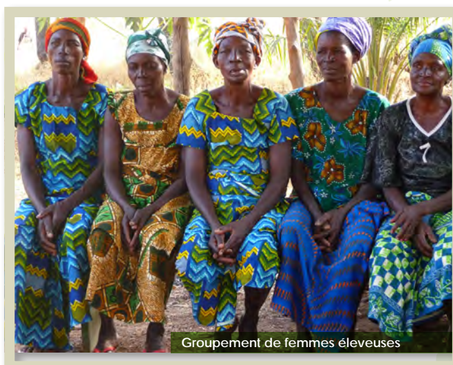
Groupement de femmes éleveuses