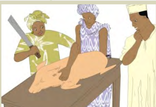
Le débitage et la vente de la viande de porcs par les femmes