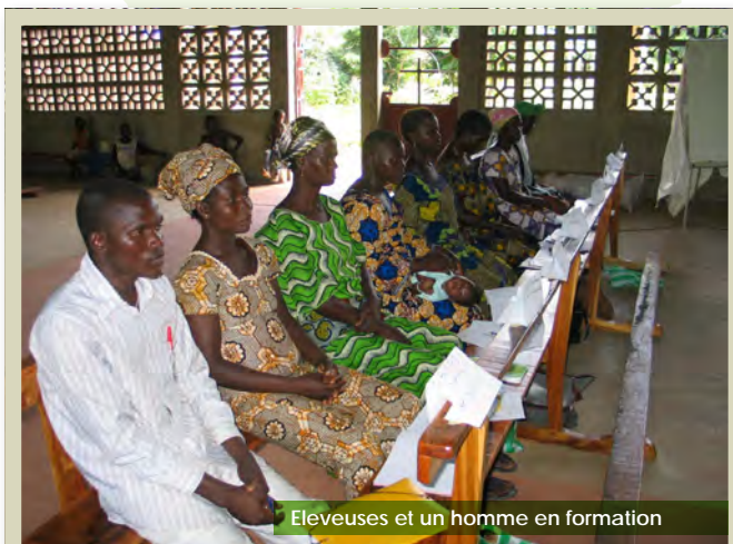
Éleveuses et un homme en formation

L'élevage de porc est une activité traditionnellement dévolue aux Femmes, mais les hommes captent l'essentiel des bénéfices de la vente.