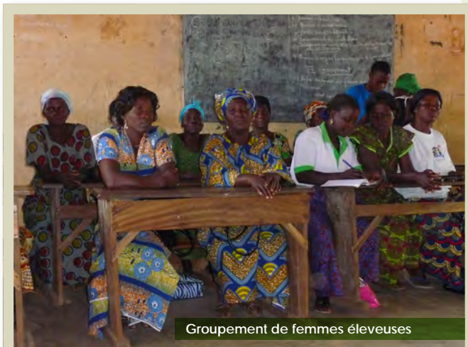
Groupement de femmes éleveuses