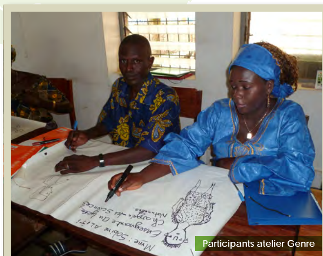
Participants atelier Genre

Analyse issue des témoignages des ateliers de formations