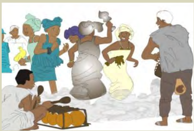
La célébration joyeuse de la route vers l'équité et l'autonomie

"Avec les bouchers, les femmes vendent les animaux vivants. Avant, elles établissaient un prix en estimant le poids de l'animal.