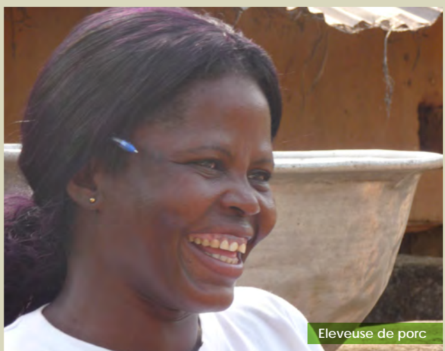
Eleveuse de porc