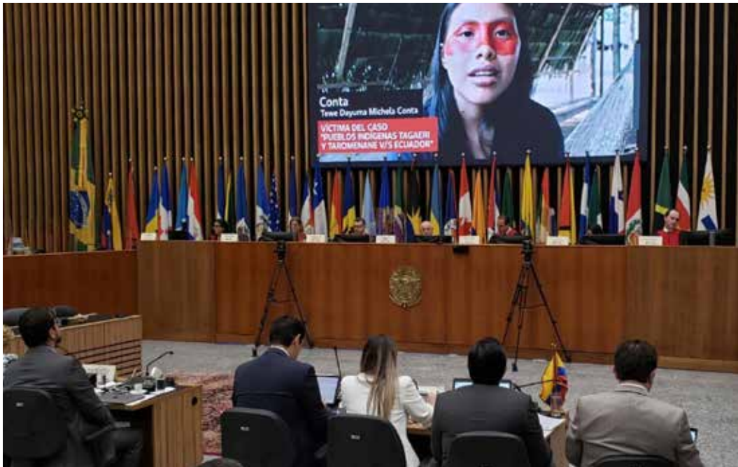
Audiencia de la Corte IDH, caso Pueblos Indígenas Tagaeri Taromenane vs. Ecuador.

Desde que se estableció el plan de medidas cautelares la CIDH ha monitoreado el cumplimiento de las acciones de remediación y prevención realizadas por el Estado en la defensa de los derechos de los PIAV. Las mismas que se consideraron insuficientes por lo que el caso pasó a la Corte Interamericana de los Derechos Humanos (Corte IDH) que ahora juzga al Ecuador por negligencia y omisión en el amparo de estos pueblos. El 23 de agosto de 2022 se realizó en Brasilia la audiencia pública ante la Corte IDH en el caso denominado los Pueblos Indígenas Tagaeri – Taromenane contra el Ecuador.