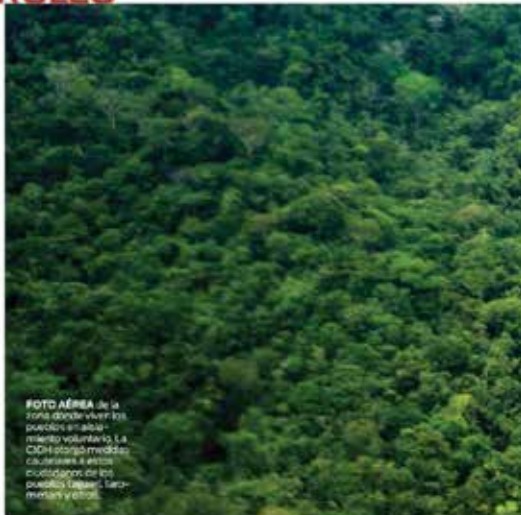
FOTO ÁREA de la zona donde viven los pueblos en aislamiento voluntario. La Constitución prohíbe cualquier actividad que ponga en peligro la existencia de estos pueblos indígenas.

En el 2006, la Corte Interamericana de Derechos Humanos había otorgado medidas cautelares luego de la matanza, en agosto del 2000, de una veintena de mujeres y niños en un asalto, por parte de un grupo waorani de Tigüño, impulsado por intereses madereros. El Estado ecuatoriano las había ac-