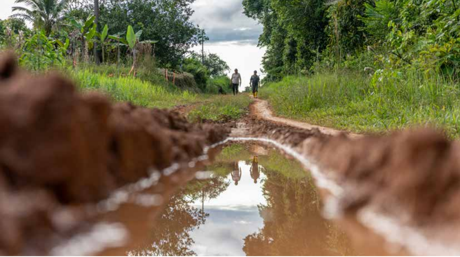
Habitantes de la Franja de Diversidad y Vida.

sentido puede llevar a fuertes condenas de acuerdo con la Constitución y las leyes.